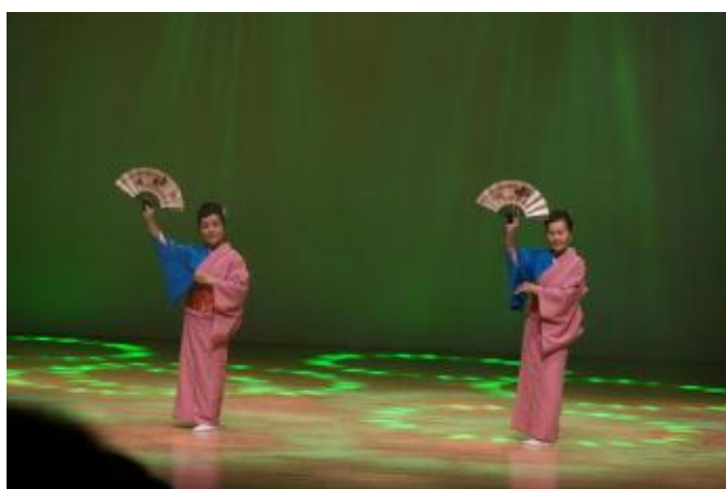
3 日舞 「人生夢桜」