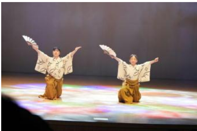
1 日舞 「ウイリアムテル」