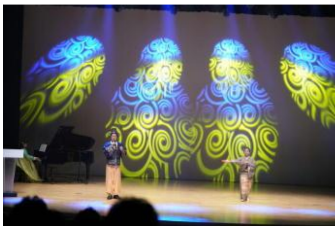
7 独唱&ピアノ&舞 「釜山港へ帰れ」