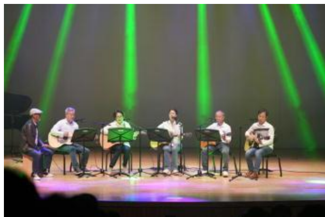
12 ダルボードレ アーコースティックギター