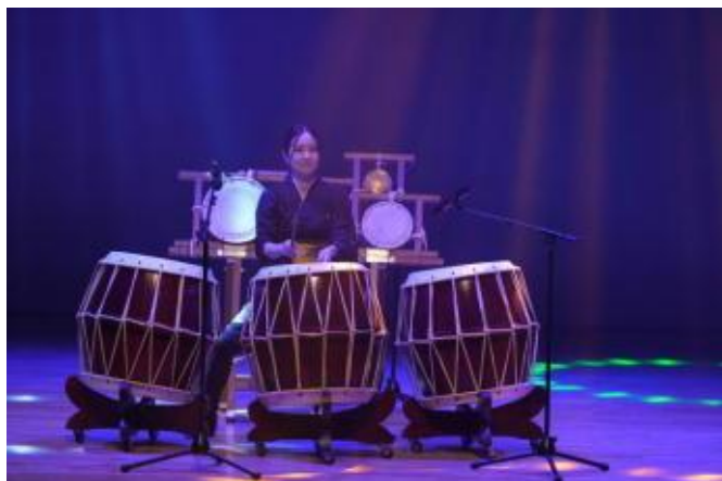
5 和太鼓 「秋田大黒舞」