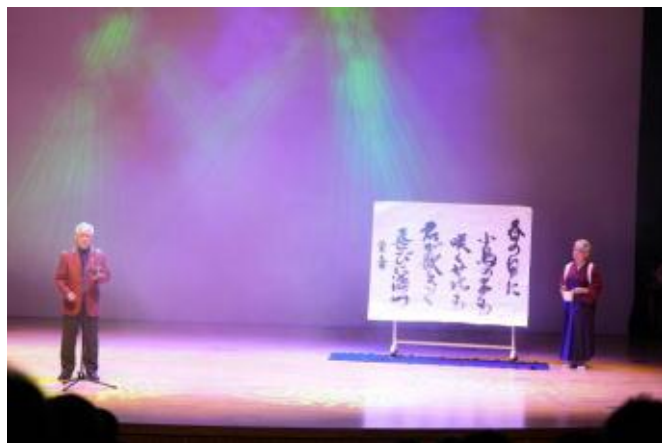
2 書道吟 和歌「春の日に」