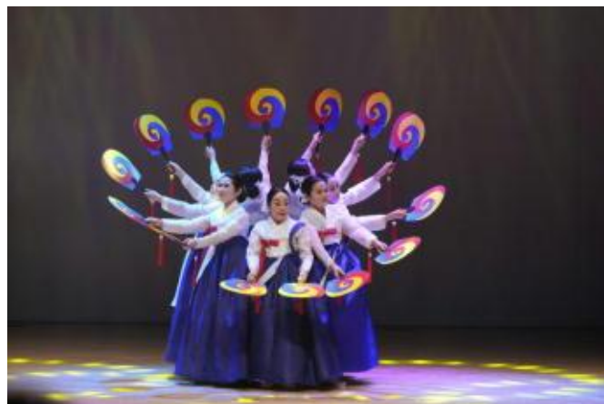
10 韓国舞踊 「ディディムセ」