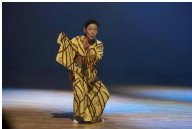
6 日舞 「繁盛ブギ」