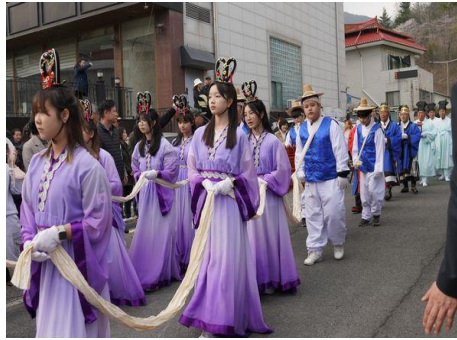
【祭典後街中を練り歩く】