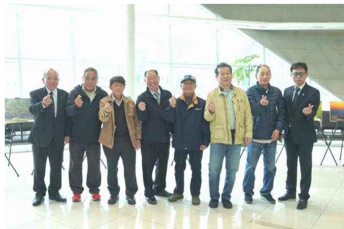
【昌寧文化院写真協会の幹部の方と】