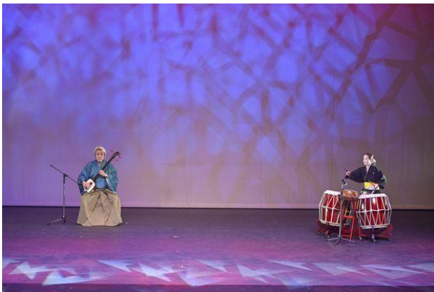
【楽器コラボ リンゼツ】