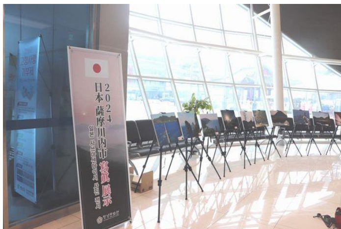
【薩摩川内市の写真コーナー】