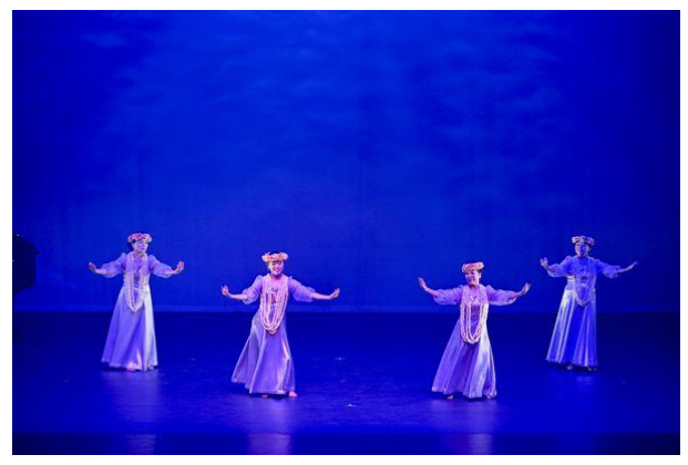
【フラ ブルーハワイ】