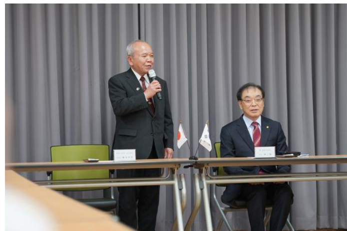
【昌寧文化院で挨拶の交換】