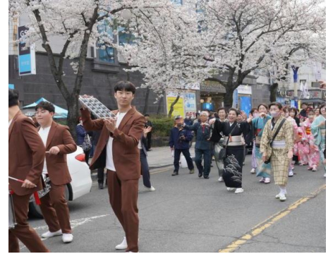
【昌寧郡の満開の桜の下を踊る】