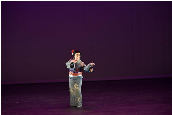
【日舞 釜山港へ帰れ】