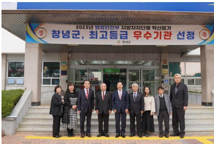
【昌寧郡庁舎前で 郡守を囲んで】