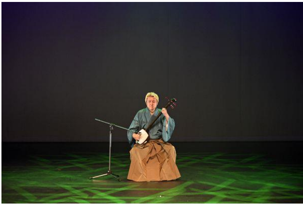
【三味線 津軽じょんがら節】