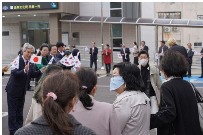
【昌寧文化院入口で大歓迎】