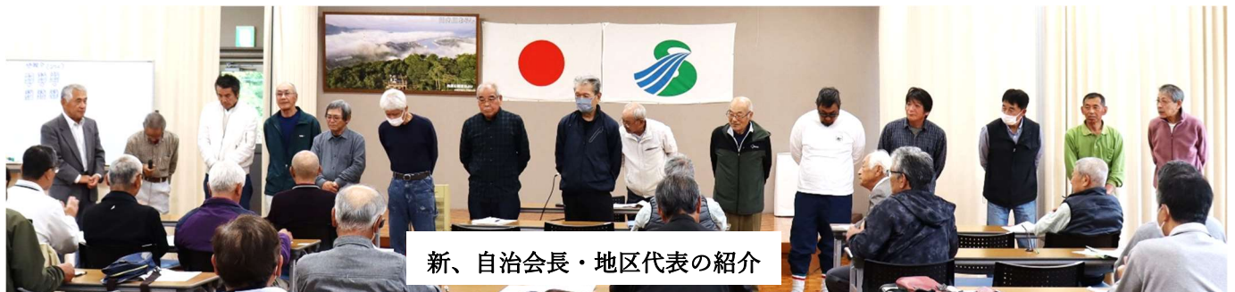
新、自治会長・地区代表の紹介