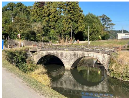
高江町 江之口橋 (薩摩川内市指定文化財)

新緑芽吹くさわやかな季節のGWはいかがだったでしょうか。きつと楽しい思い出が追加されたのではと察します。 最近ではスマホで手軽に思い出が残せます。あなたの力作の一枚を、LINE等で、当コミ協便りに投稿してみませんか。連絡はコミ協 大迫まで