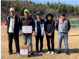
パークゴルフ 尾賀・後牟田ブロック