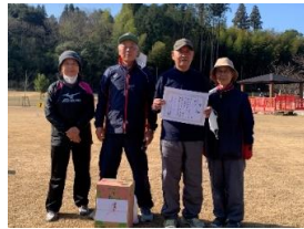
グラウンドゴルフ 都ブロック