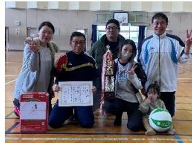
ソフトバレー 原ブロック