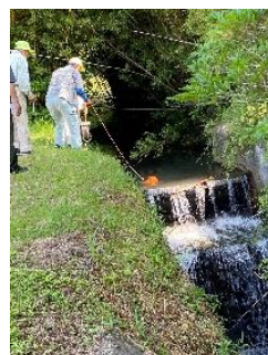
暑い中、お疲れさまでした

7月27日、10箇所の水質検査を行いました。水も綺麗でした。水温差が、6℃もあったのには、少し驚きました。(22℃(下木場川源流)と28℃(寺田橋))検査の値も昨年同様に良かったです。