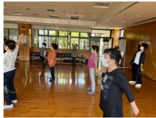
体がほぐれて気持ちよさそうです