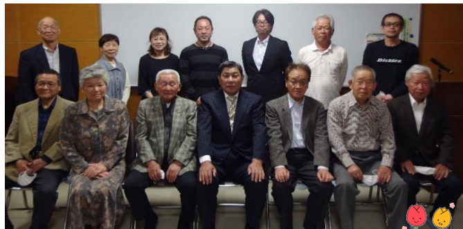
コロナ禍でも出来る事をやります！