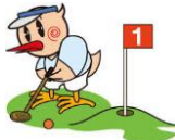
ホールインしました