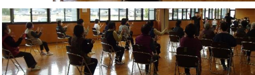
年明けて最初の講座、みなさんの元気な顔を見られてうれしかったです。