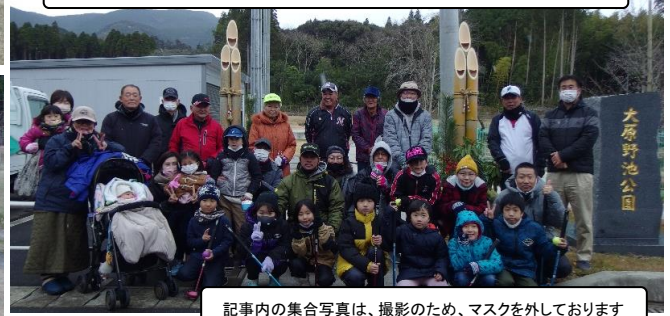
記事内の集合写真は、撮影のため、マスクを外しております