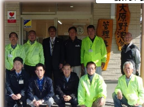
パーク開園の日、市の職員や地区コミ役員が集合