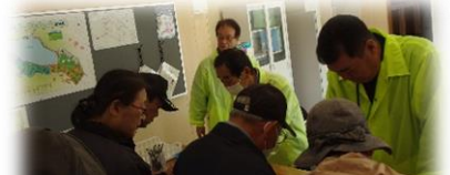
慣れない受付にバタバタ