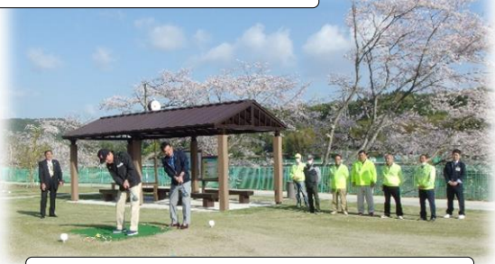
市の建設整備課の方々の打ち始め