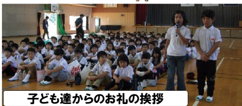
子ども達からのお礼の挨拶