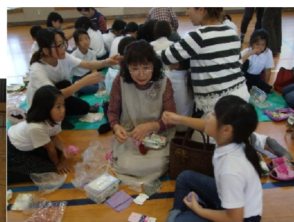
お手伝いいただいた方々、ありがとうございました