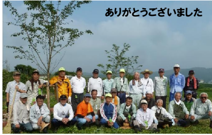
ありがとうございました

児童の通学路防犯のために整備した2つの広場、思いのほか、石も多く、竹が生い茂っております。定期的にコミの有志の方々に伐採をおこなっております。毎回、ありがとうございます。大変な作業に感謝します。