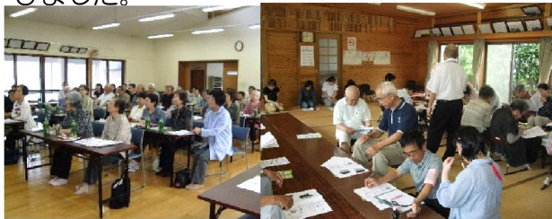
歯の模型を使つての指導が分かりやすいです。

まず、健康観察があり、認知症の講話、認知症は症状の理解、早期診断、早期治療が必要とのこと。口腔ケアでは、歯の大切さを学びました。