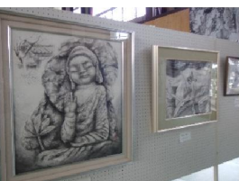
教室の方々の1年の成果の作品展示