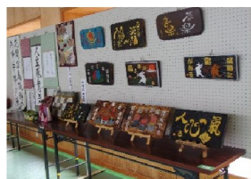
今年は自治会からの作品展示が大変賑やかでした