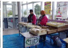
女性部会 むっかん販売