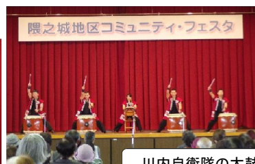
川内自衛隊の太鼓

12月2日(日)師走にしては暖かい一日でした。盛大にコミュニティフェスタ開催。皆様のご協力で、設営も順調に出来、作品展示も大変賑やかで、ステージも多く方々が参加してくださいました。外の販売も大好評でした。今回は、「ハートフル紫雲閣」「花ごよみ」「エヌ・フーズ」様からワンタッチテントを頂き早速外のブースで使いました。大変助かりました。ありがとうございました