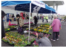
外の販売も大好評でした