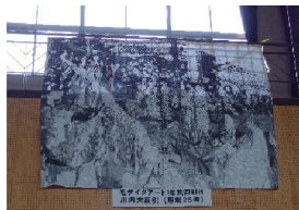
南中・隈小 作品展示ありがとうございました