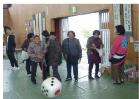
ゲームコーナー 保健福祉部会