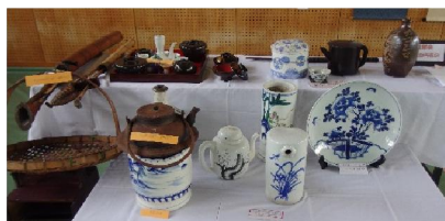
「私の宝物」コーナー 平佐焼など