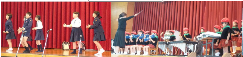
いろいろなジャンルの踊りがありました

12月2日(日)師走にしては暖かい一日でした。盛大にコミュニティフェスタ開催。皆様のご協力で、設営も順調に出来、作品展示も大変賑やかで、ステージも多く方々が参加してくださいました。外の販売も大好評でした。今回は、「ハートフル紫雲閣」「花ごよみ」「エヌ・フーズ」様からワンタッチテントを頂き早速外のブースで使いました。大変助かりました。ありがとうございました