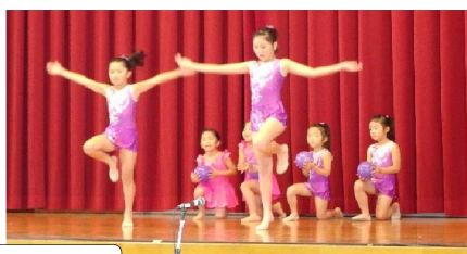
多くの子ども達の参加