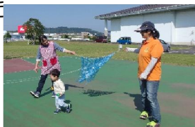
楽しそうに遊んでいます