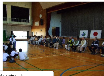
お手伝いいただいた方々、ありがとうございました