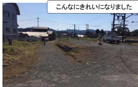
こんなにきれいになりました

隈之城駅周辺の通学路の整備をしました。役員や部会員の方々のご協力で、草刈りをし、見通しもよくなりました。毎回、草刈りにご協力頂き、大変感謝しております。ありがとうございます。