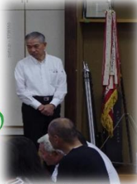
祝勝会には、市長が来てくれました。

地区コミ主催のイベント会議など以外は スタンプ押せません。お持ち下さい。 (市主催のものには押せません)