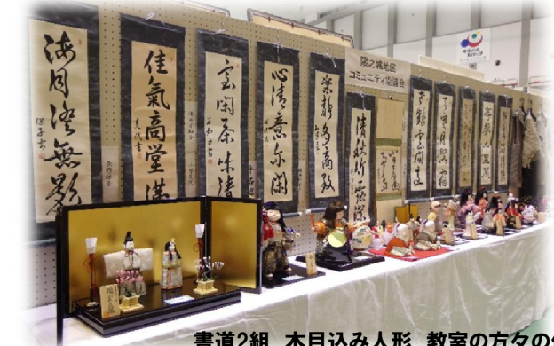
書道2組 木目込み人形 教室の方々の作品