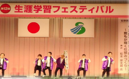
原フレンド会の方々