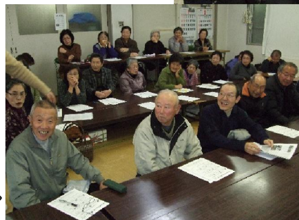
男性の参加が多い地域でした