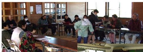
最近、寸劇が大変喜ばれています。

2月9日(木)勝目団地ふれあいサロンを開催。このブロックでは、初めての開催でした。男性会員が多い地域で、普段のサロンでも、男性の出席が多いそうです。寸劇とゲームを楽しんでいただきました。