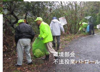
環境部会 不法投棄パトロール