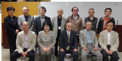
27年度新役員です。よろしくお願いいたします。