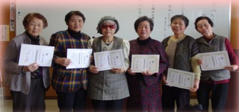
皆勤賞の皆様。1年間お疲れ様でした