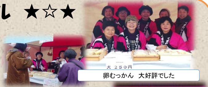
大 250円 卵むっかん 大好評でした