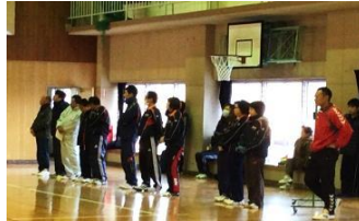
体育部会員いつも朝早くから元気一杯です