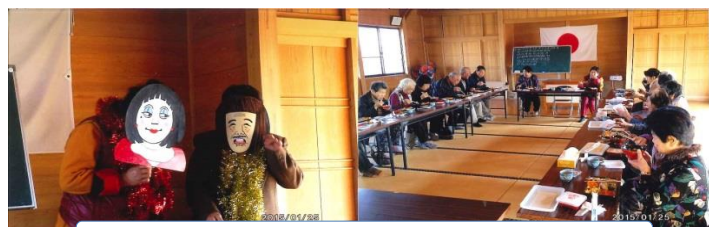
「だめよ～ダメダメ」のあと、会食を楽しみました。