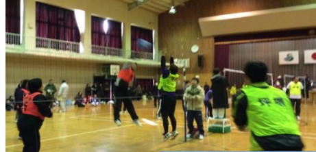
迫力あるアタックがあちこちから