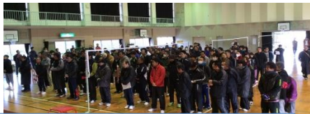
毎年、多数の参加ありがとうございます