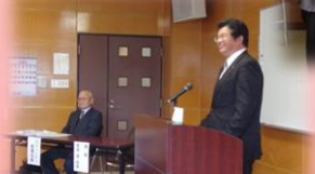
常深校長の楽しい講話でした