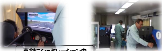
真剣にシュミレーション中