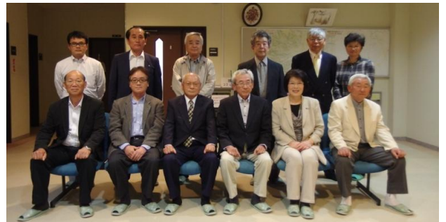
26年度新役員です。よろしくお願いいたします