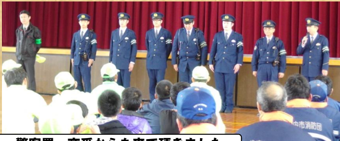
警察署・交番からも来て頂きました

パレードは、雨のため、車両のみとしました。今年も地区コミでは、青パトをはじめ、あいさつ運動や交通安全教室など、各部会で、地域の安全・安心のため、活動していきたいと思っています。