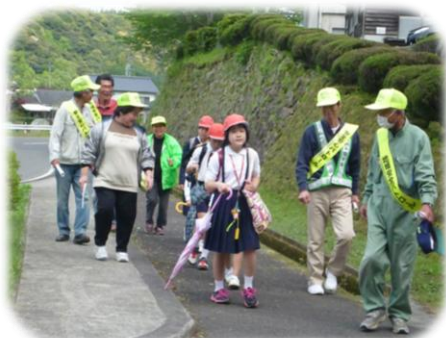
楠元、戸田方面です！

中村駐在所家村さんのお話の中で、大きな声を出す練習がありました。22名の子どもたちは、とっても大きな声を出していました。不審者に声をかけられても大丈夫だと感じました。