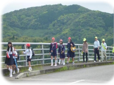
正込、久住、瀬越方面です！