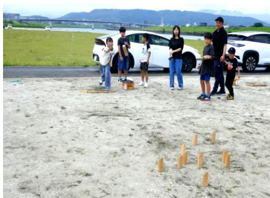
モルック体験会に親子で参加