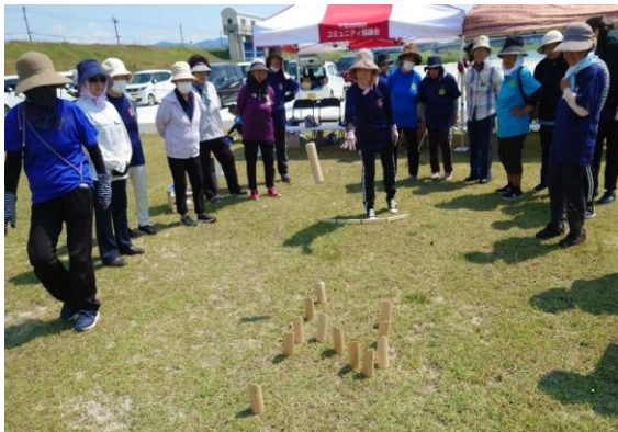
わいわいサロンで注目の一投

6月6日、14日には、少年軟式野球大会が開催されるなど利用が本格化。一方、トイレや階段については注文も。河川敷ならではのやむを得ない事情もありますが、関係機関に要望をしていきます。ご利用の際は、地区コミ事務局へご連絡ください。