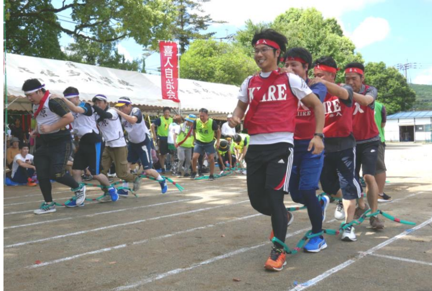
力強い応援に因えて、さあ抜くぞ！（喜入）