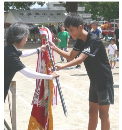
優勝旗を手にする大明神チーム

台風の通過により、前日まで開催が危ぶまれましたが、当日は雨の心配もなく、絶好の運動会日和。幼児から高齢者まで、楽しく過ごせた一日となりました。