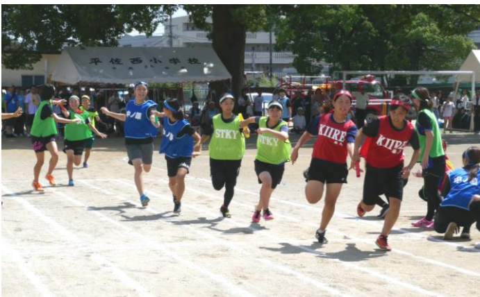
最後のリレーはいつも白熱します