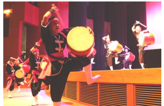
盛り上がった琉球国祭り太鼓

舞台発表午前のは、平佐西小学校吹奏楽部によるオープニングの演奏で始まり、今回初の試みの午前中だけの「抜き打ち抽選会」が大好評。今年の特別出演には「琉球国祭り太鼓」を招待。琉球獅子も登場し、観客席も一緒になって演舞を楽しみました。市民交流会場では各自治会にカラフルなテントが並び、いっそう楽しい雰囲気でした。子どもを対象としたコーナーには駄菓子やお面も売られ、バルーンアートや電気の実験で過ごす子どもの姿がみられました。会場で久しぶりに出会い、話が弾む様子があちこちで見受けられました。