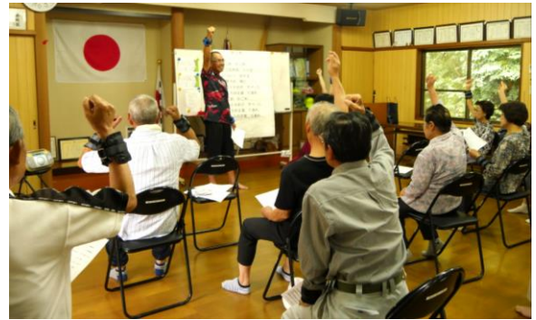
おもりを腕に。気分はもうアスリート(喜入)

10月1日、喜入公民館には20人の会員が参加し、新規の種目に取り組んでいました。