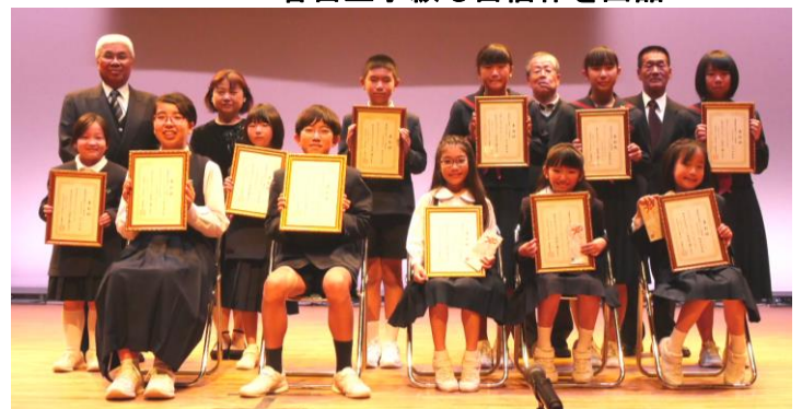
俳句短歌コンクール受賞者の皆さん