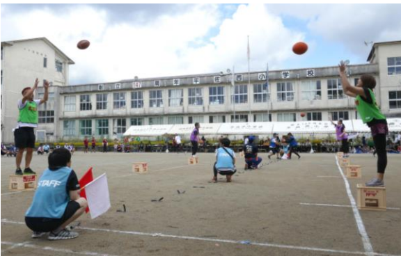
どこも苦労しました「ボールは踊る」

9月8日平佐西小学校で第29回平佐西地区大運動会が行われ、接戦の末大明神チームが優勝し、三連覇を成し遂げました。