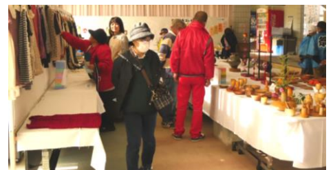
各自主学級も自信作を出品