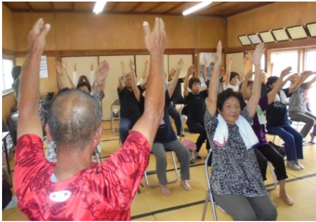
楽しみながら健康維持を目指します