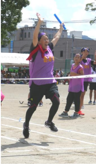
女子リレー 1位の寄奥城