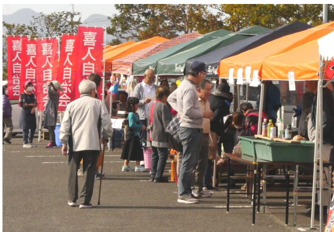
今年は各自治会のカラフルなテントが並びました