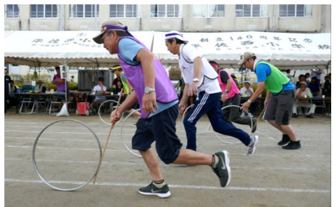
輪回しリレー。高齢者は元気で強いぞ！