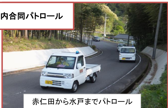
赤仁田から水戸までパトロール