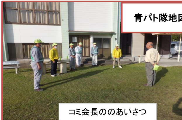
コミ会長のあいさつ