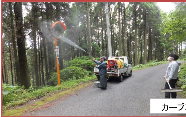
カーブミラー磨き隊

五月十五日(日)クリーン作戦(空き缶・カーブミラー磨き)を行いました。二十五名の参加者でした。道路もカーブミラーもきれいになりました。ありがとうございました。