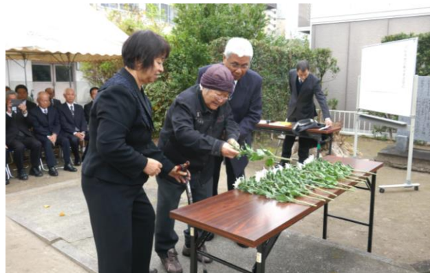
献花をする参列の方

12月2日、平佐西小敷地内招魂碑前で、戦没者追悼式を行ないました。当日は遺族17名を含む56名が参列。追悼のことばのあと、全員で献花を行ないました。戦争で犠牲になられた方々の冥福を祈り平和を願う式典となりました。