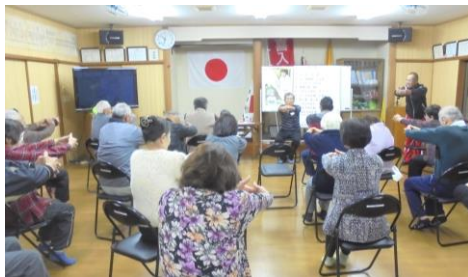
喜入いきいきサロン

ながら、みんなで地域の高齢者を支えていくことを確認できた懇話会になりました。〈まごころささえ愛事業〉