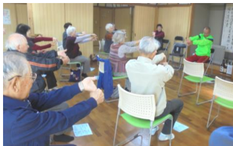
中ノ原ふれあいサロン