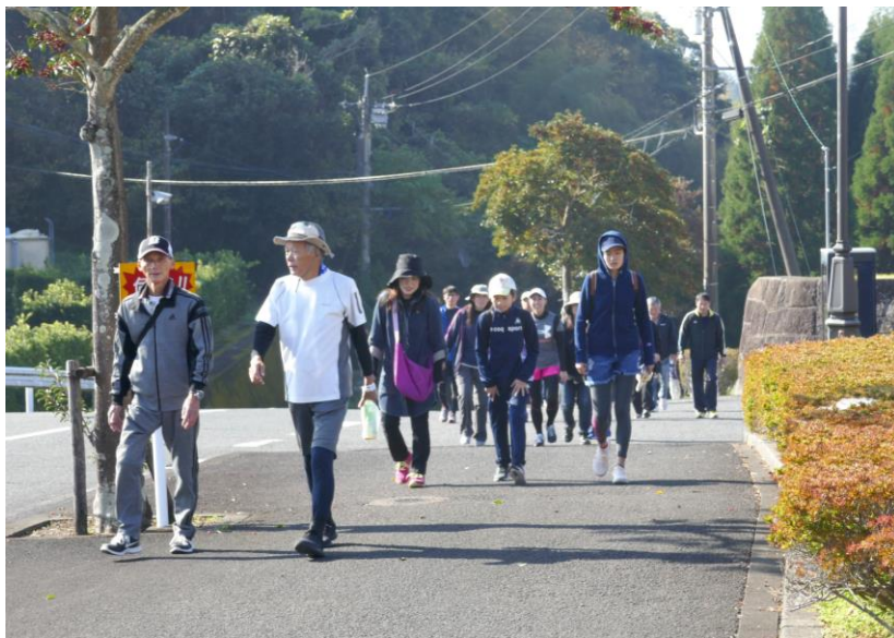
さあ、これからきつい上りに入ります(純大前付近)