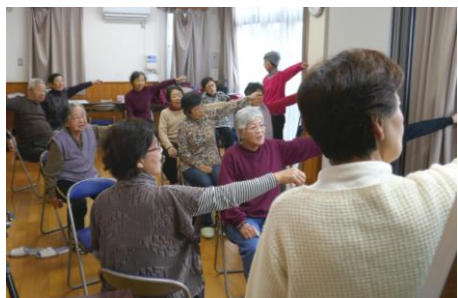
鳥追いきいきサロン