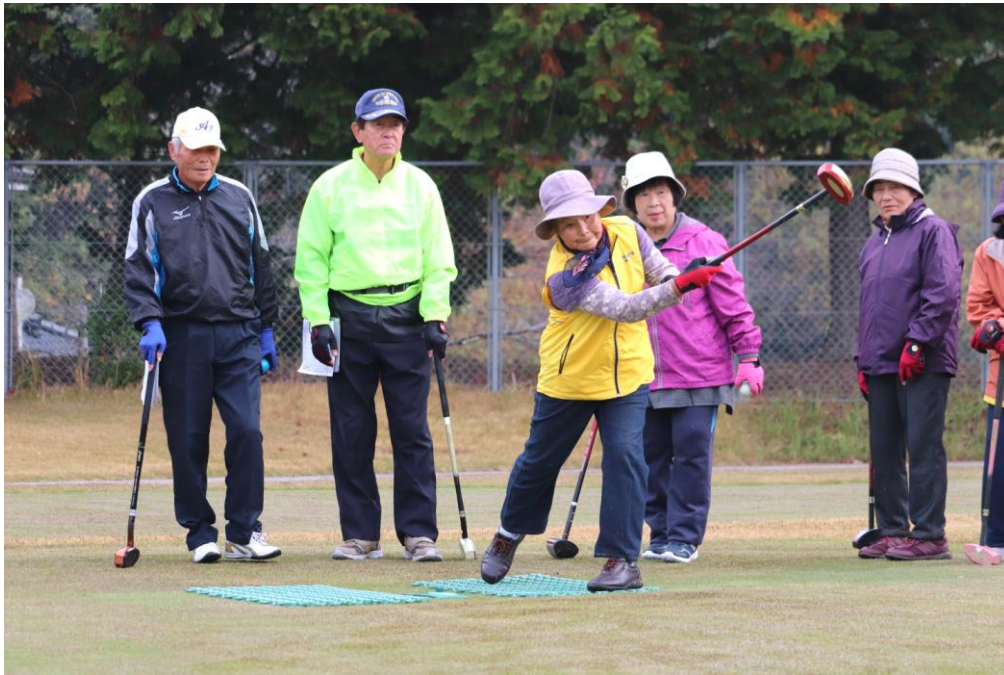
チームの力を合わせてがんばります。さあ、スタート

高齢者の皆さんが楽しみにされているコミ主催のグラウンドゴルフ大会。昨年度後期の大会は、冷たい雨の下での試合で大ブーイング。明けて今年度春季大会は、本番、順延日ともに雨にたたられ中止。そして今回やっと後期大会を11月21日、榎脇グラウンドゴルフ場で1年ぶりに開催できました。参加チームは、35チームの183人。あちこちで、ホールインワンが入り歓声が上がるとともに、楽しげな華やいだ会話と交流が交わされていました。 〈高齢者部〉