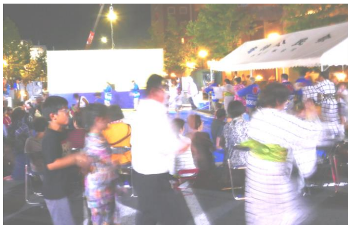
フィナーレはみんなで盆踊り (寄奥城 7/28)