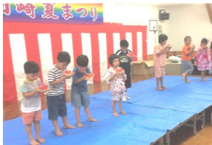
ここはすいかの早食い競争(田崎 7/28)