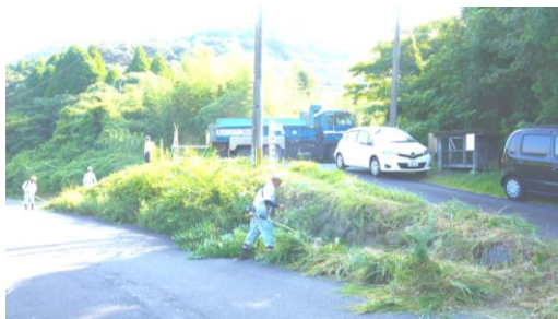
県道沿いも大変見通しが良くなりました

ゴールド集落である皿山地区では川内川沿いの県道からの入り口をはじめ地区内市道横の藪払いや溝など作業していただきました。また、県道山崎川内線沿い、