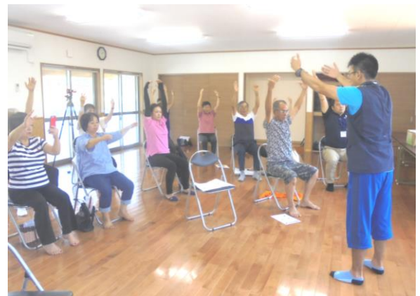
ほんとけん体操でいつまでも健康維持を