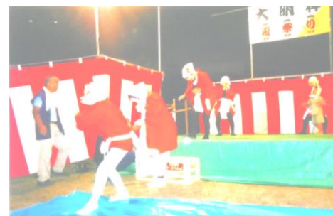
キツネも登場(大明神 7/28)