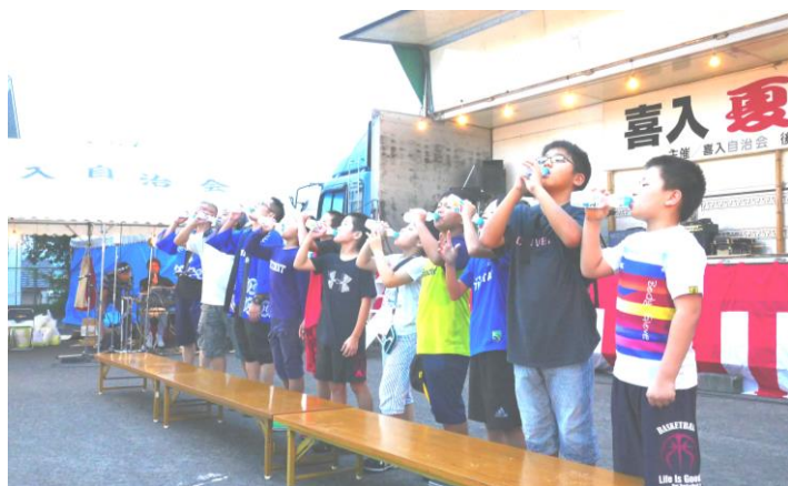
どこも人気の早飲み大会(喜入 8/18)