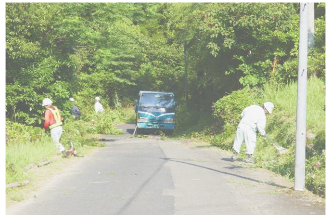
市道沿いもきれいになりました

通称「芝桜ロード」の邪魔になる樹木を今後の植栽作業に先立って伐採していただきました。暑い中の作業、本当にお疲れ様でした。