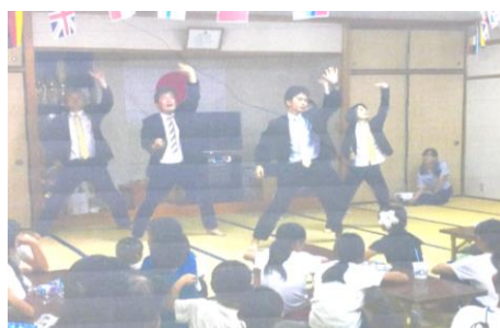
引っ張りだこの「役所の衆」(草原 7/21)

8月18日、Aコープ平佐店駐車場で夏を締めくくる「喜入夏まつり」が開催され、多くの人で賑わいました。この夏、平佐西地区では多くの夏祭りが開かれ、地区民の皆さんが交流されました。これらはすべて自治会や青壮年の皆さんの力で開かれており、地域の結束を感じるものでした。