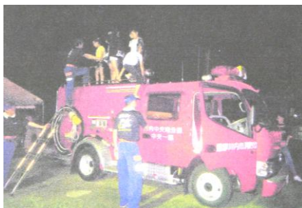
なんと消防車の乗車体験も(中ノ原 7/21)