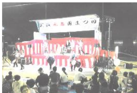
2年に一度の天辰元気夏祭り(天辰 8/4)