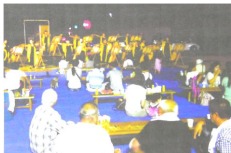
酒も入り、よか晩じゃんな(碓山 7/28)