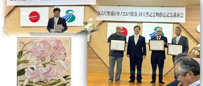
甌島片野浦のカノコユリ群落 国天然記念物指定記念講演会