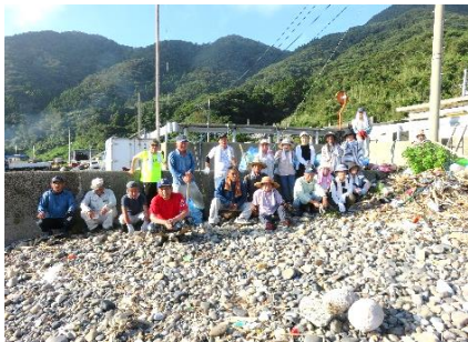
(集合写真)暑い中22名参加