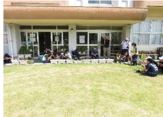
屋久島・種子島の仲良しコミスポクラブ