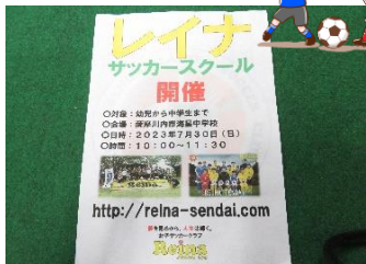
レイナサッカースクール