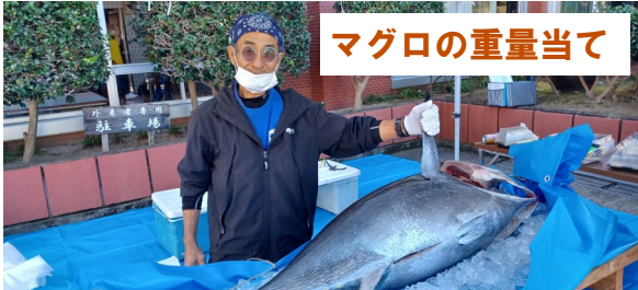
マグロの重量当て