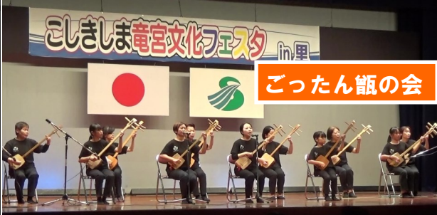
こししま竜宮文化フェスタ in 里 ごったん飯の会