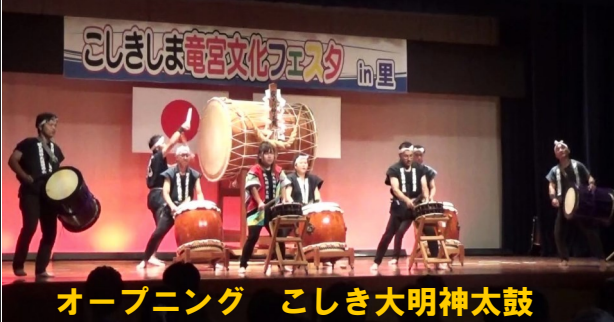
オープニング こしき大明神太鼓