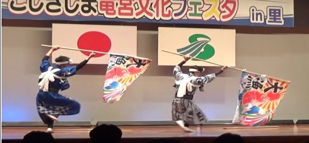
川内から清乃本流