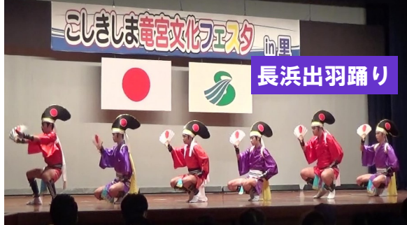
こししま竜宮文化フェスタ in 里 長浜出羽踊り