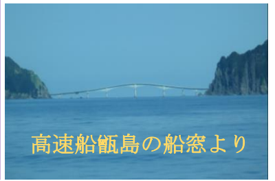
高速船甌島の船窓より