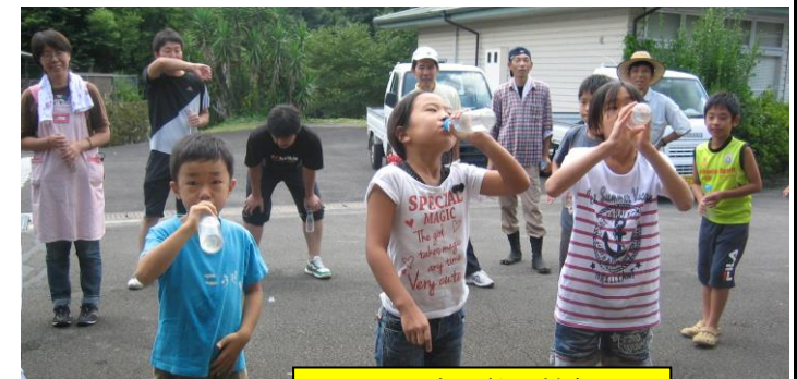
ラムネ早飲み競争