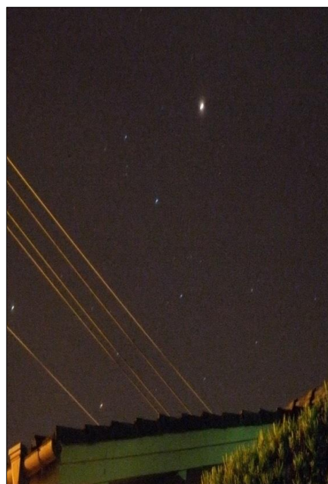
6月1日(水)午後8時ごろの夜空に赤い宝石