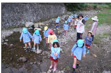
近くの小久留主川で水遊び