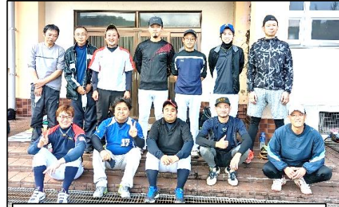
皆さん揃って大活躍。久しぶりの明るい話題に元気をいただきました♪

選手の皆さん一人ひとりが素晴らしい動きを見せ、終始なごやかな雰囲気で行った試合に参加出来たことが今大会の優勝に繋がったのではないかと思います。ご協力いただいた皆様、本当に有難うございました。