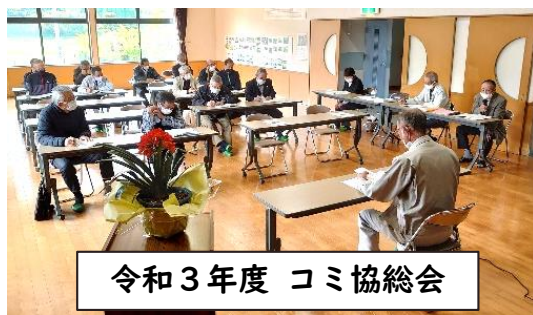
令和3年度 コミ協総会

最後に、コロナ感染症が早く収束して、日常生活の回復に向けて【元気な～!】【おやっときゃあ!】【きばいもんそ!】などの声かけ運動で地区民の一体感を更に図り、地区コミュニティ協議会活動にご参加いただき、ご指導、ご助言、ご協力のもと地区の活性化を図り、「黒木の故郷づくり」に努めて参ります。