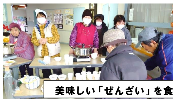
美味しい「ぜんざい」を食べてニッコリ笑顔