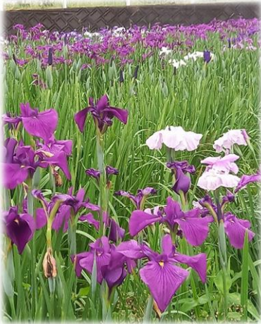
諏訪神社前の花菖蒲（上） 東郷学園前の紫陽花（下）