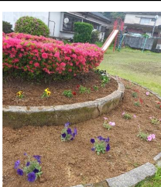
舟倉公園の花も満開で祝福しています。

地区コミ会長として6期12年と永きにわたりリーダーシップを発揮し地区の振興と活性化に尽力くださいました。