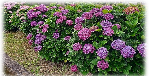
東郷学園前にはたくさんの手まり咲種

近い将来、地区内に新たな紫陽花ロードが完成しそうです。ここは、旧谷ノロ公民館前。