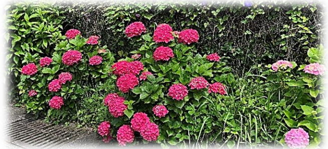
小路自治会は、真っ赤な色が印象的

梅雨真最中の6月も斧淵には花いっぱいです。紫陽花が地区のあちこちで満開を迎えました。