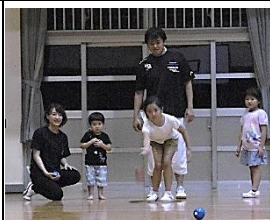
上 バタック 下 スポレック