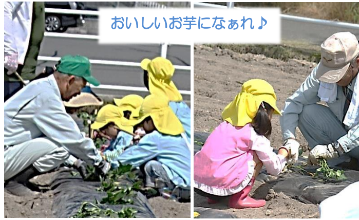
おいしいお芋になあれ♪

快晴となったこの日、園児は汗をかきながら懸命に作業を続け、喉の渇きに根を上げることなく、植えたばかりの苗に、持参したペットボトルいっぱいのお水を撒いていました