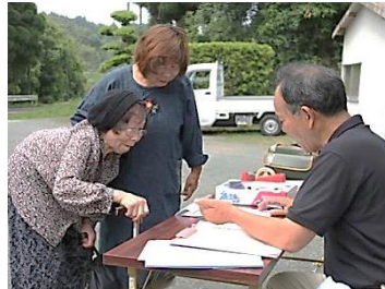
自治会長による避難者受付