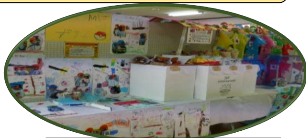
すわこども園 SECOND さん作品

11月13日（日）～11月18日（金）の6日間、育英地区コミュニティセンター内で開催しました文化祭には、育英校区以外からも多数来館いただきました。