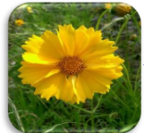
オオキンケイギク

一見きれいな花ですが、在来種を守るために駆除した方がいいので見かけたら、根元から引き抜き乾燥させて燃えるゴミ袋に入れて収集してもらいましょう。