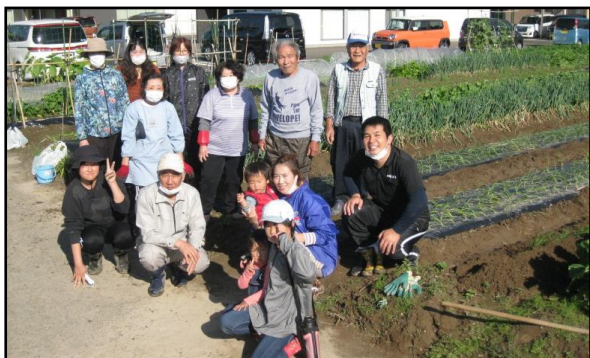
玉葱の苗 2000 本植えました。