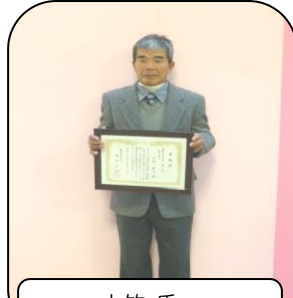
上竹氏 おめでとうございます