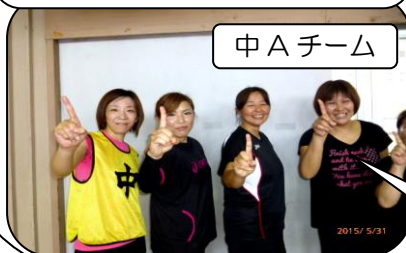
中 A チーム