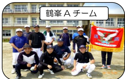
鶴峯 A チーム

家族の声援・仲間の声援を背に白熱した試合が繰り広げられました。選手の皆さん・応援の方々お疲れ様でした。