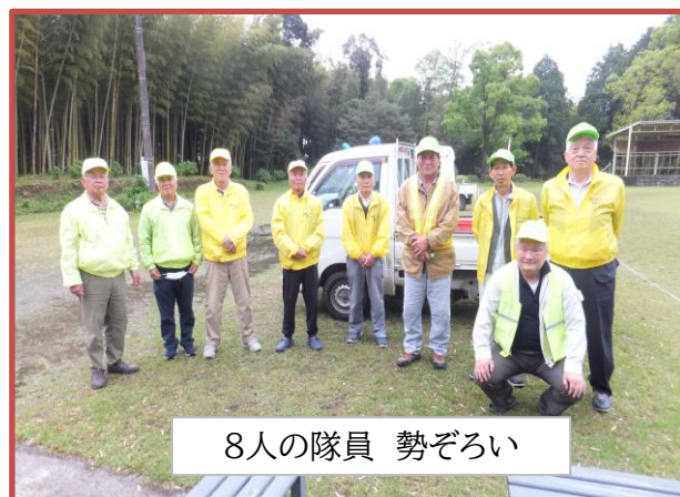
8人の隊員 勢ぞろい

4月24日(金)、17時から地区内の青色防犯合同パトロールを行いました。8人の隊員の方々に地区内をパトロールしていただきました。皆様のお陰様で安心安全な生活が守られています。本年度も1年間よろしくお願ひ致します。