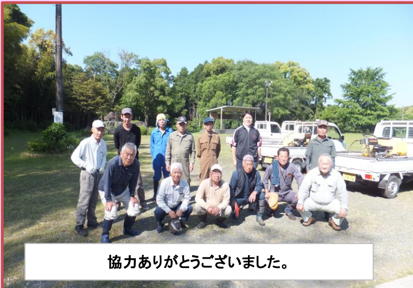
協力ありがとうございました。

5月17日(日)に、八重地区クリーン作戦(カーブミラー清掃)を行いました。昨年、大雨により中止となり2年振りの開催となりました。当日は、お忙しい中、各自治会よりお集まりいただき、4班に分かれて地区内の約60個のカーブミラーを磨いていただきました。2年振りの開催ということもあり汚れが目立っていましたが、皆様のお陰できれいになり、見通しもよくなり事故防止にもつながります。ご協力ありがとうございました。