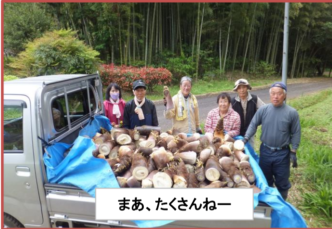
まあ、たくさんねー

4月11日(火)竹林同好会の方々がコミセンの隣のたけのこ堀をされました。だいぶ大きくなっていましたがみんなで手分けして運んだり積み込んだりされました。軽トラックいっぱい採れたようです。お疲れさまでした。