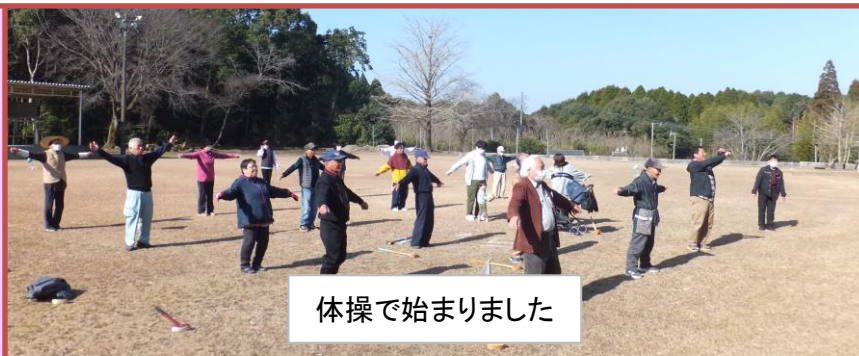
体操で始めました