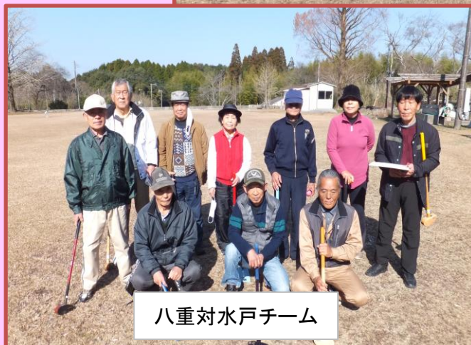
八重対水戸チーム