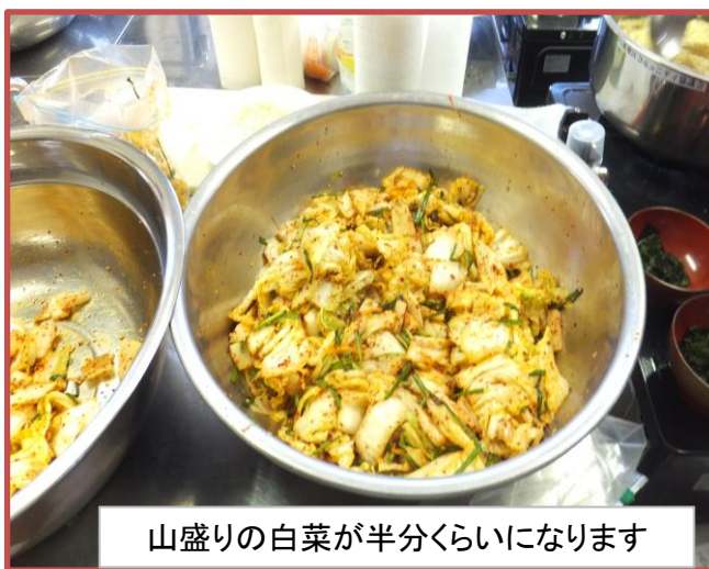
山盛りの白菜が半分くらいになります

3月9日(木)有志でキムチ作りをしました。韓国人の方が教えて下さいました。本場、韓国から取り寄せて頂いた香辛料を使っておいしいのが出来ました。色々な料理にアレンジできますのでレパートリーが広がります。