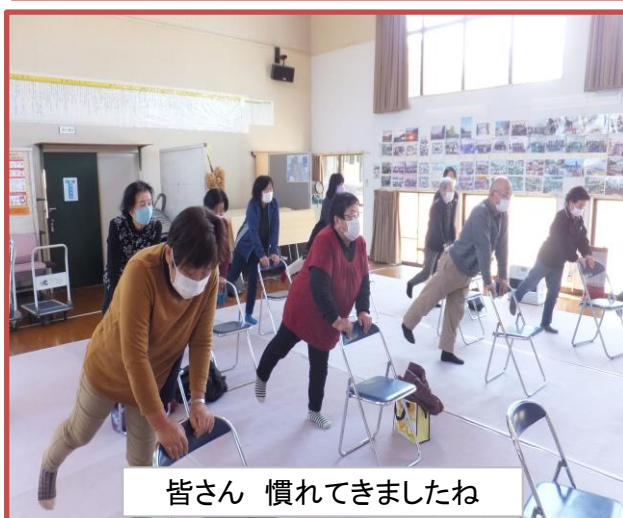
皆さん 慣れてきましたね

3月2日(木)はんとけん体操がありました。講師の先生が来られこれまでの成果をみて頂き、ユーモアたっぷりの笑いの中にしっかり指導をしていただきました。簡単なようで結構体力を使います。県下をあちこち指導に回っておられるようでありがたいことです。お疲れさまでした。