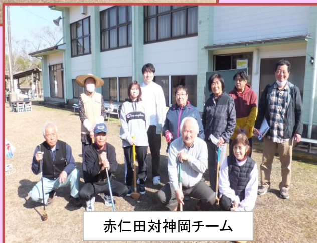
赤仁田対神岡チーム