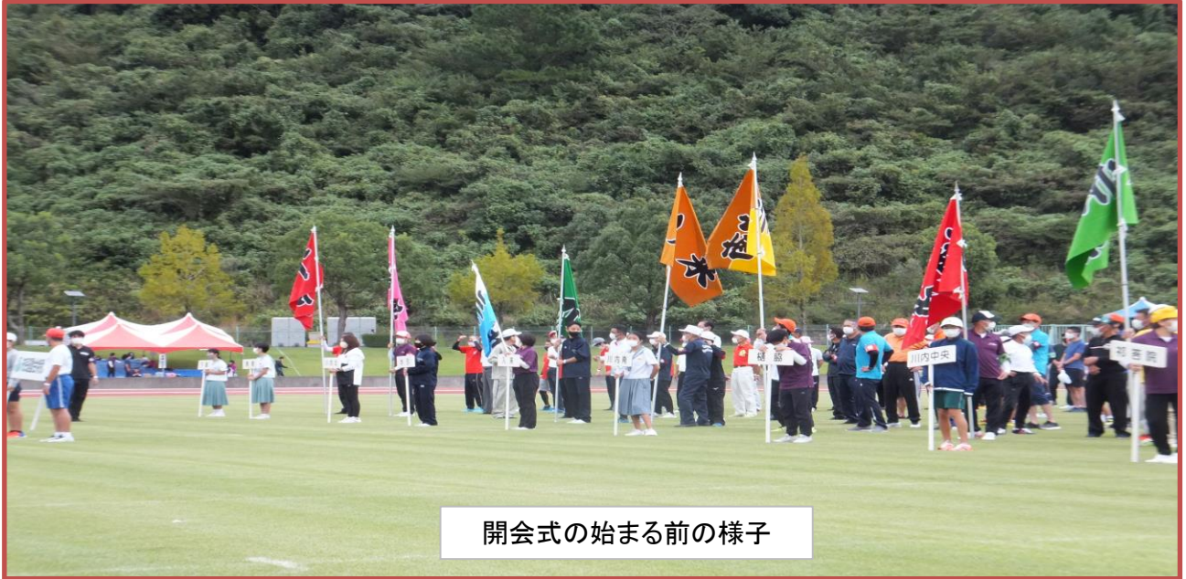
開会式の始まる前の様子