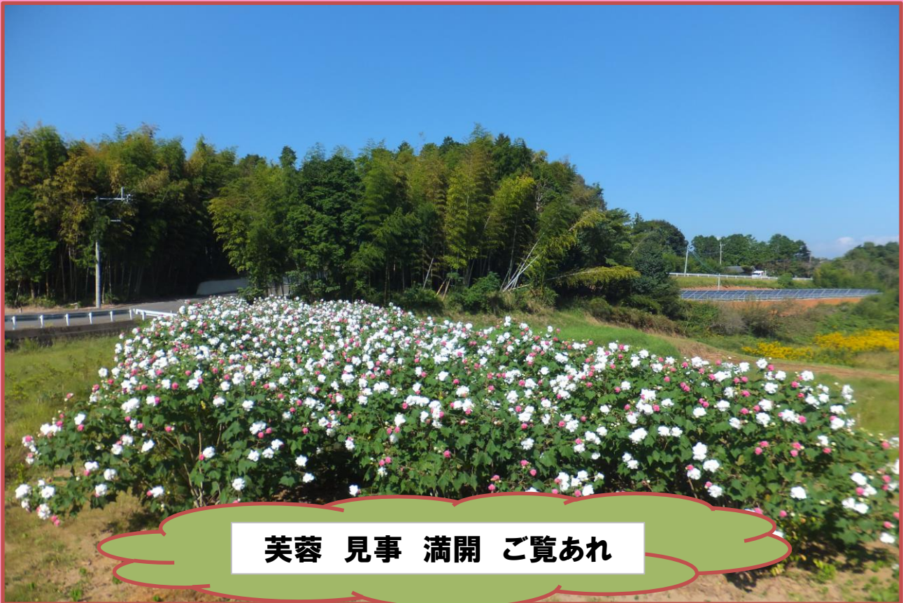
芙蓉 見事 満開 ご覧あれ