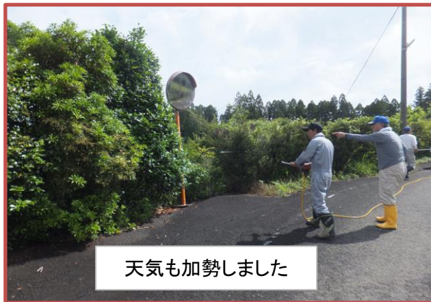
天気も加勢しました