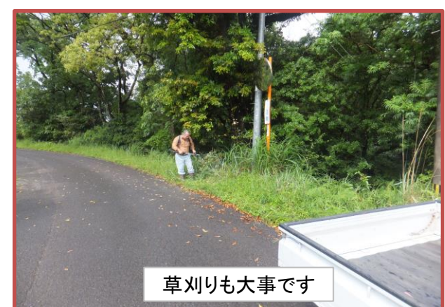
草刈りも大事です