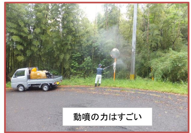
動噴の力はすごい