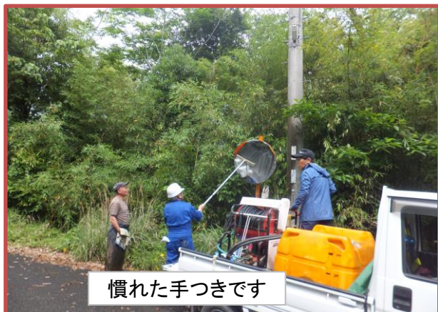
慣れた手つきです